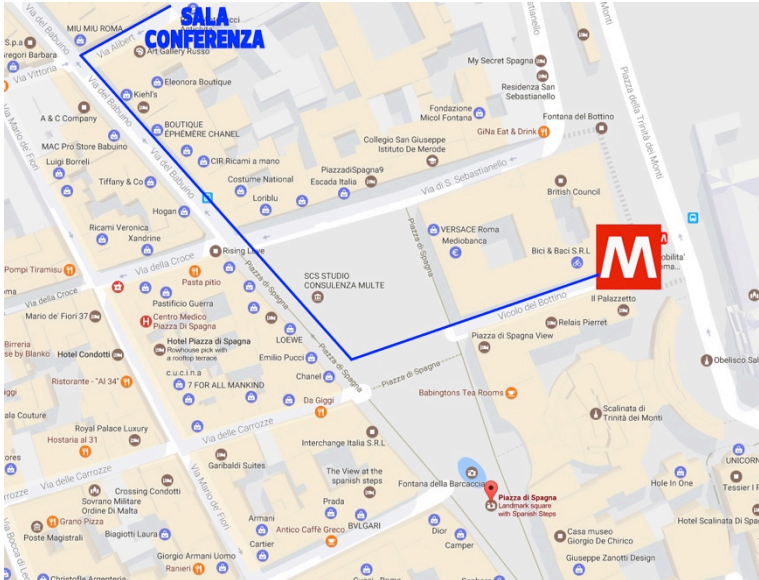
Ingresso della stazione della metropolitana da vicolo del Bottino