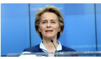
Il discorso sullo stato dell'Unione europea 16 Settembre 2020