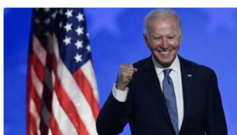
Perché Trump rimanga una parentesi 08 Novembre 2020