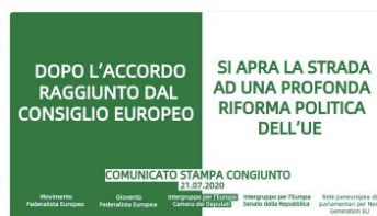
Comunicato stampa sull'accordo raggiunto dal Consiglio UE 21 Luglio 2020